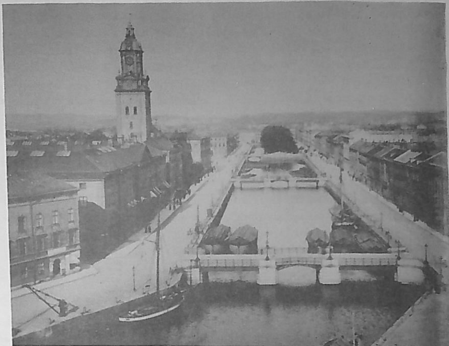
Stora Hamnkanalen vid 1890-talets början - perspektiv från Wijkska huset mot öster.