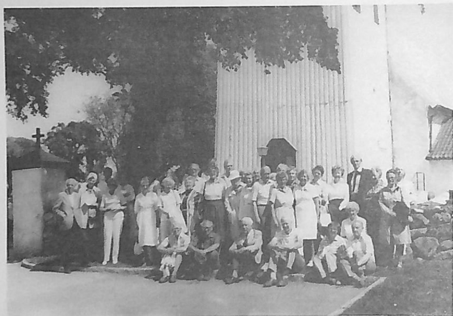
Från vårutfärden 1985 till Nord-Halland och Onsala. Deltagarna samlade utanför Onsala kyrka.