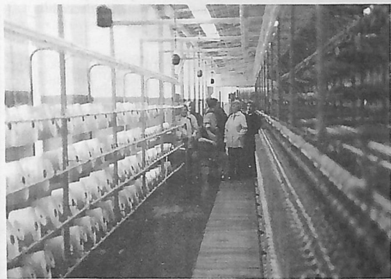
I spinneriet på Rydal.