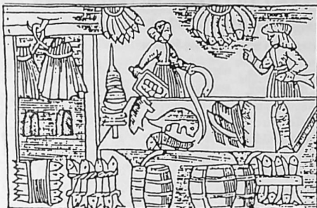
Handel med fisk, ill. ur Olaus Magnus Historia.

Sill fördes upp till Bergslagen, som med sina järngruvor, hyttor och hamnarverk då var vår enda egentliga industriella bygd. Silltunnorna blev en naturlig returfrakt på de tomma foror som forslat järnet ned till handelsmännens lagerhus.