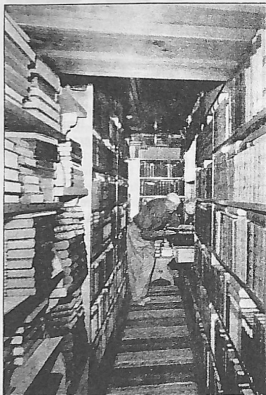
Interiör från Gustav i Kloas bokhus. Foto Jan Mark Han har även tagit de två andra bilderna i artikeln.

Band efter band tar han ut, smeker över pärmen, visar på främmande exlibris, bladdrar betänksamt innehållet, stannar vid en bild om det finns illustrationer och ställer sedan volymen på sin plats. (-)