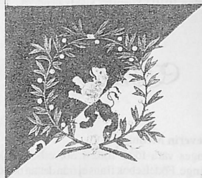
Exempel på fanan med Skaraborgs lejon på diagonalt delad duk i gult och svart, skönt broderad på siden.

Den 28 juni 1709, mycket tidigt på morgonen, ställde så den svenska armén, ca 19.000 man, upp till strid vid Poltava. Skaraborgs regemente stred till fots. Mannarna var utrustade med flintmusköter och värjor och vissa var pikenerare. Bröstharnesk var nu bortlagt. Regimentet var decimerat till endast en bataljon om drygt 500 man. Varje kompani hade en egen fana.