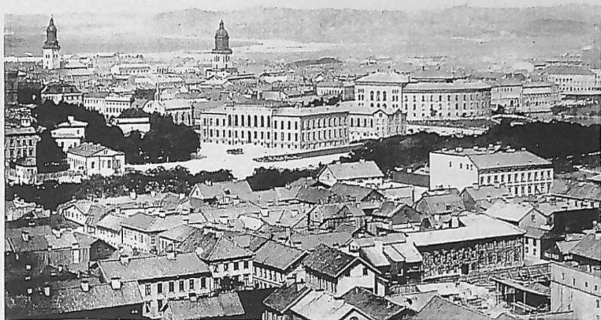
UTSIKT FRÅN SKANSEN KRONAN ÖVER HAGA.