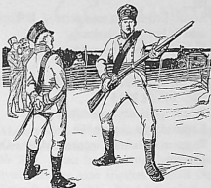
TECKNING AV ALBERT EDELFELT