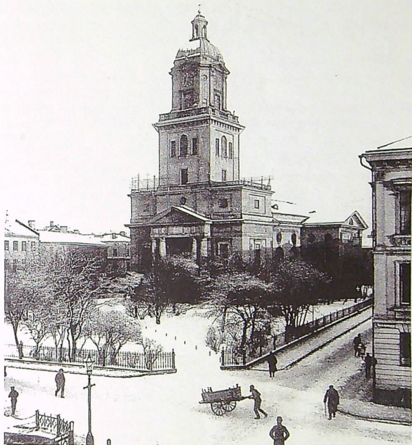
Gustavi Domkyrka i Göteborg

Ritad av Carl Wilhelm Carlberg, påbörjad 1802 och invigd 1815.