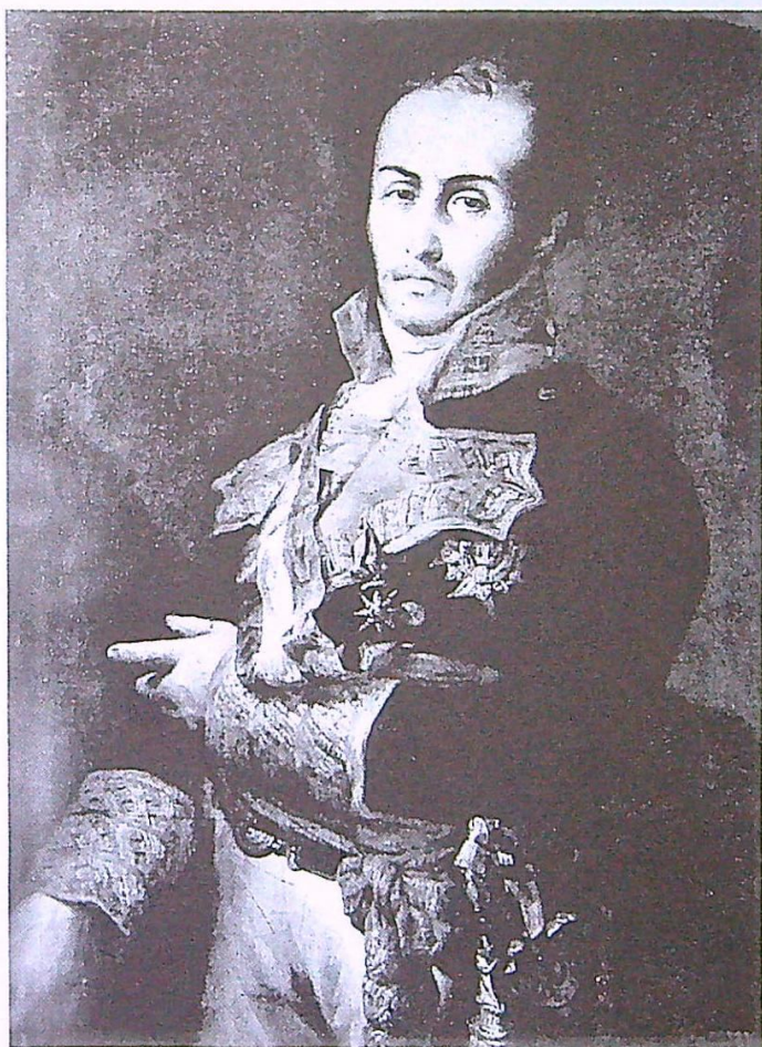
Markis Pedro Caro Sureda de la Romana, 1761-1811, förde spanska trupper genom Sverige. Artikel sid. 6.