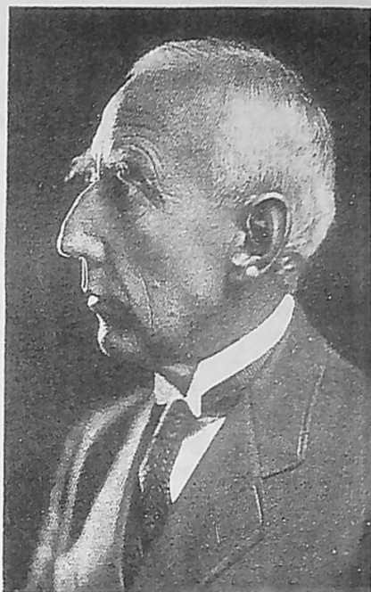
Roald Amundsen, 1872-1928

Efter en månads väntan reste man runt den karibiska övärlden tillbaka till Buenos Aires för att därifrån runda Cap Horn och segla norrut mot San Francisco. Färden avbryts emellertid i Buenos Aires, där