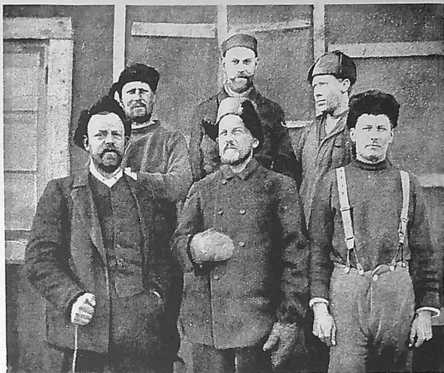
De sex i polarstationen på Snow Hill vid räddningen i nov. 1903.