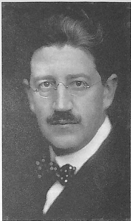
Carl Skottsberg, 1880-1963