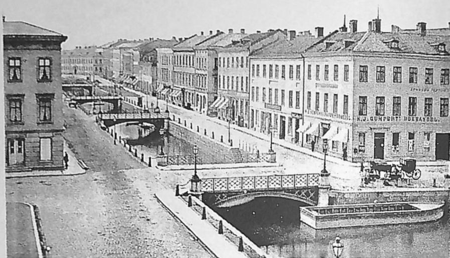
År 1871 flyttade Gumperts bok- och pappershandel till hörnet vid Södra- och Östra Hamngatan, 'GUMPERTS HÖRNE'.

som just inkommen populärlitteratur, allt med prisexempel - från 4 skilling (= 8 öre) och uppåt. Hösten 1845 inledde han med att som särskild bilaga till Handelstidningen (jfr nutida reklamalster) sända ut en "Förteckning på Böcker av Värde till betydligt nedsatta Priser". Det stora dragplåstret blev dock "Carl Mikael Bellmans samlade Arbeten", till vilket han dessförinnan lyckats förvärva ensam förlags- och distributionsrätt för Sverige och Finland, vilket naturligtvis innebar en enorm framgång. "Requisitioner emottages och expedieras skyndsammast" hette det. Två år senare tillhandahöll han "Illustrerad Söndags-Magasin", en av de första inom svensk veckopress. Vid samma tid började Gumpert även bjuda ut en omfattande jullitteratur och nu från eget förlag. De billigare populärskrifterna försvann efter hand från bokhandelsdisken för att i stället hamna i cigarrbodas och marknadsstånd. Som det dåtida firmanamnet angav omfat-