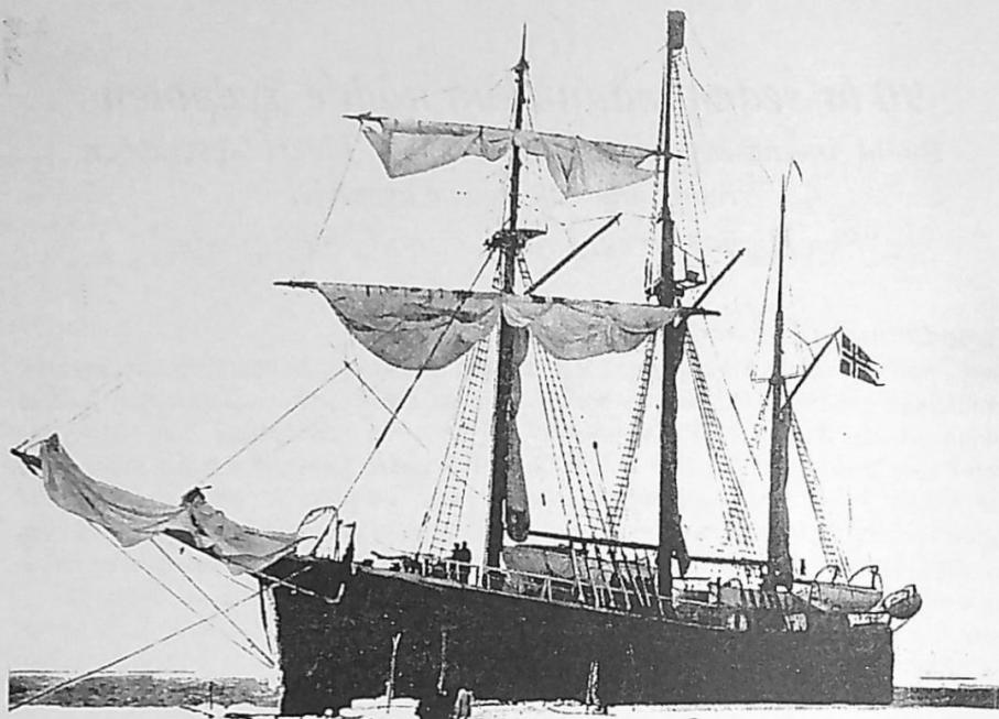
"FRAM" vid isbarriären i Valbukten, febr. 1911

sommar i Antarktis, med temperaturer upp till -10 grader Celcius.