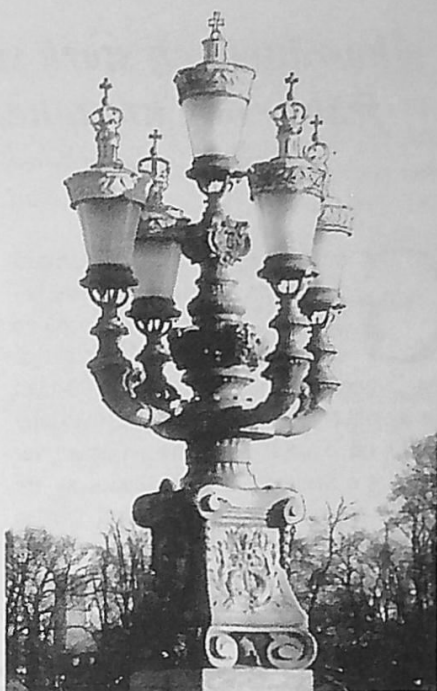
Kandelabrarna har idag elektriskt ljus.