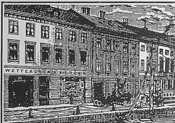
1882 startade vi på Södra Hamngatan i Göteborg.