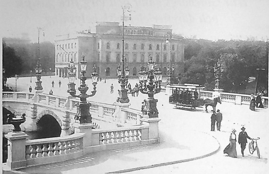
Kungsportsbron från nordost, invigd 1901, med gasluskandelabrar.

av Göteborgs Stad år 1888 när det nya gasverket med sin stora gasklocka var färdigt på Hultmans holme. Då kunde den s.k. stadsgasen även levereras till gaskaminer, gasspisar m.m.