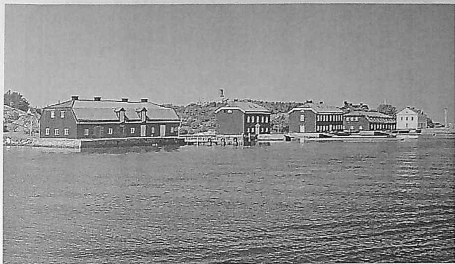
Kängö karantänsstation med raden av sjukhusbyggnader