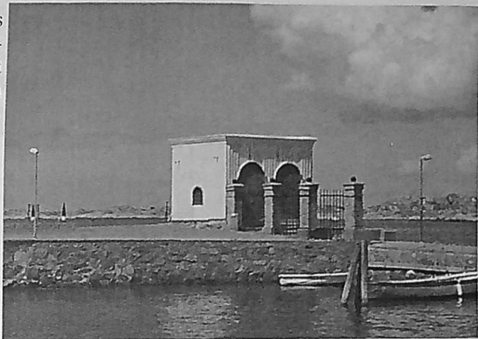
Parloiren vid bryggan.

personer in för avlusning för att hindra spridning av fläcktyfus. Men några pestsjuka har aldrig vårdats på Kängö och det är tveksamt om Kängö egentligen haft någon avgörande betydelse ur smittskyddssynpunkt. Koleran spreds ju trots kontrollerna. Kanske bidrog karantänen till att förbättra hygien och sjukvård ombord på fartygen, eftersom det blev både dyrt och opraktiskt för redare och köpmän med en sjuk besättning och försenade leveranser.