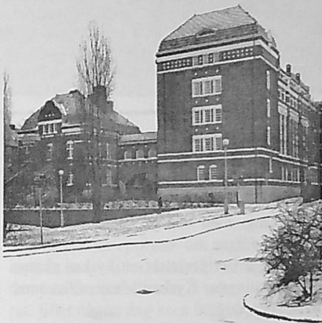
Landsarkivet 2007 Foto: Per Lm

När kyrkan blev fri från staten är kyrkan inte längre att betrakta som en myndighet,