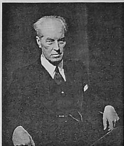
Torgny Segerstedt 1876-1945

Samma dag ger Segerstedt svar på tal i sin I dag -artikel, som han avslutar med: