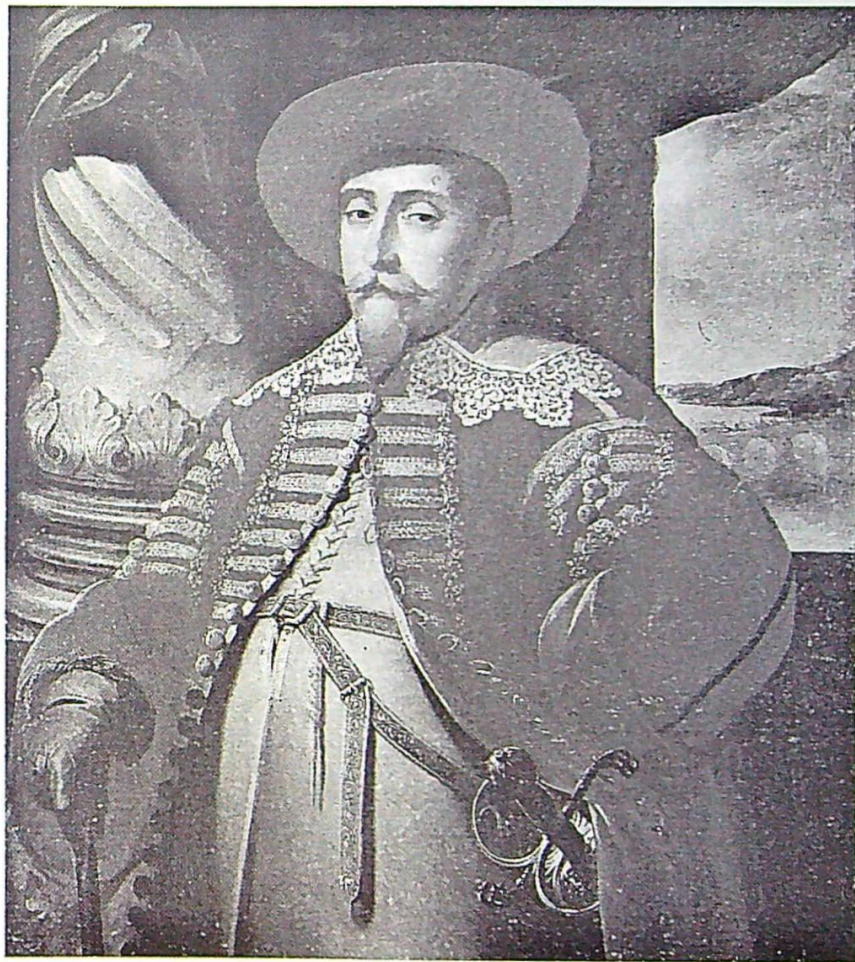
"Gustaf II Adoif im polnischen Rock", porträtt av Matthäus Merian der Ältere, omkring 1632. Skokloster slott. — Lützen-minnen, se sid 14.