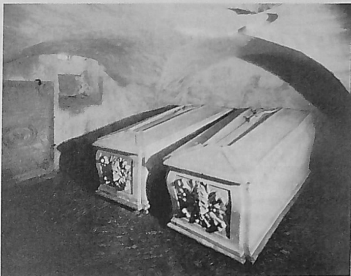
De båda marmorsarkofa- gerna i Onsala kyrka.