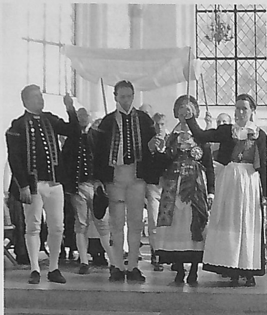
Ett skånskt brudpar under brudpäll. I Skåne hade bruden sällan krona, eftersom det inte varit brukligt i Danmark, bruden hade istället en stilig piglock med la (band).

och lade sig ovanpå täcket – flickan låg under täcket, vanligen iförd inte bara särk utan också extra överdel och minst en underkjol. Pojkarna vaktade på varandra, och besöket ansågs framgångsrikt om flickan inte vände ryggen till. Förvånansvärt få barn blev till under de här omständigheterna, men prästerskapet ogillade (kanske inte så oväntat) den här seden.