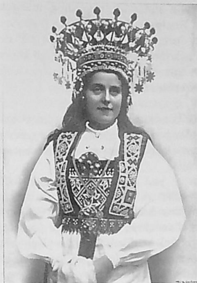
Norsk brud med brudkrona, ca 1900. Norska kronor var en aning annorlunda konstruerade så att brudarna kunde ha utslaget hår; svenska brudar fick i allmänhet sätta upp håret för att kronan skulle sitta kvar.

en judisk man och en kvinna tillhörig statskyrkan ingå äktenskap; den enda lösningen blev att införa en form av civil vigsel, som dock bara kunde tillämpas i sådana här fall. Först 1908 blev borgerlig vigsel ett alternativ för vem som så önskade.