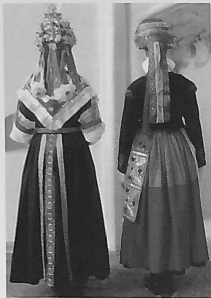
Det var viktigt att bruden också tog sig bra ut bakifrån; det är ju det enda som syns under själva vigseln. Den skånska bruden (t.h.) kunde ståta med sin tvåfärgade kjol och en massa band medan dalabrudens (t.v.) krage med pärlpynt var lika stor bak som fram.

bruden var änka. Visade det sig lite senare att kvinnan ljugit om sin oskuld, fick hon betala böter – traditionellt för att kronan måste "omföryllas" för att "renas".