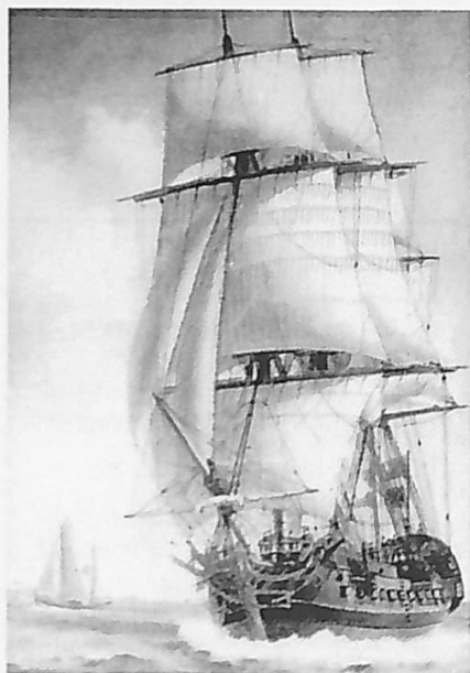
Ostindieskepp vid Vinga. Målning av Jacob Hägg. - Sjöfartsmuseet i Göteborg.

Säkerligen har dessa auktioner ombord på ostindiefararna varit betydligt vanligare än vad vi kan avläsa i bevarade handlingar, och de ägde förmodligen rum efter varje avlidne sjöfarare. Detta var i enlighet med gällande författningar. Det erhållna auktionsbeloppet togs sedan upp i kompaniets räkenskaper som en tillgång och fördes upp på den avlidnes konto. När fartyget återkommit till hemlandet kunde beloppet lyftas av de efterlevande. De få protokoll som blivit bevarade har förmodligen blivit det på grund av att någon form av tvist eller juridisk tveksamhet dröjt kvar. Som en röd tråd mellan flera av de avlidna här i förteckningen löper det faktum att de var ogifta och/eller kanske avgivit någon form av äktenskapslöfte till en kvinna i Göteborg eller rent av upprättat ett testamente till hennes fördel. Släktingarna kom sedan ofta att ifrågasätta detta och en förhandling ägde rum inför rådhusrätten.