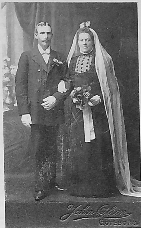
Ett brudpar från Dyrön i Bohuslän, runt sekelskiftet 1900. Bruden har svart klänning med vit slöja - lägg märke till brudgummens tunna vita handskar, det ansågs extra fint.

Allmogen gick på tvärs mot det vita. I vissa delar av landet hade brudarna fortfarande