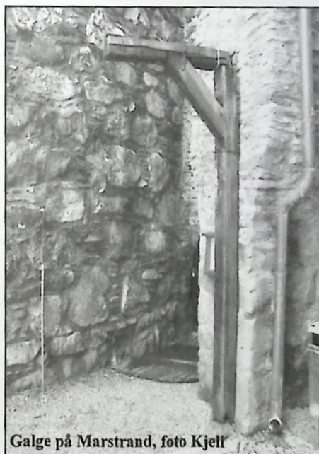
Galge på Marstrand

Landsarkivet i Uppsala oktober 2010 Linda Oja