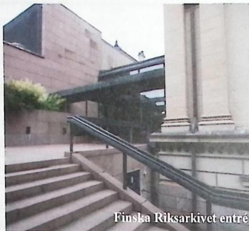
Finska Riksarkivet entré

Jag bemöttes med stor vänlighet. Uppgifter om min Peterzenska släkt plockades fram. Jag blev förvånad över det finska riksarkivets låga datorisering. Jag hänvisades i stort till mikrofilmläsning. Svensktalandet var inte totalt.