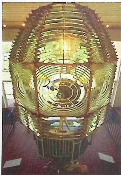
Måttig 1:a ordningens Fresnel-lins (från fyren på Cape Canaveral, FL).

fransmännens flaggskepp bland fyror, Cordouan; detta skedde redan år 1823 (linsen uppfanns 1822). Fresnellinserna graderas i en fallande sjugradig skala, där de tre första (största) användes för angränsningsfyror medan de fyra mindre användes för ledfyror och i hamnar. För stora insjöar, som t.ex. the Great Lakes i USA/Kanada, utvecklades en särskild lins med gradering "3,5". Fresnel-linsor används än idag men man har börjat byta ut dem mot annan, modernare teknik; linsorna används dock i andra sammanhang där ett absolut jämnt ljus fordras.