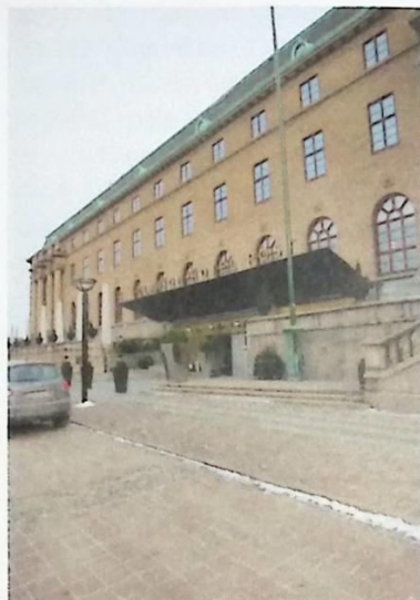
Fd Postkontoret på Drottningtorget

Sammanlagt kom brevcensuren att öppna 50 miljoner brev runtom i Sverige under åren 1939-1945.