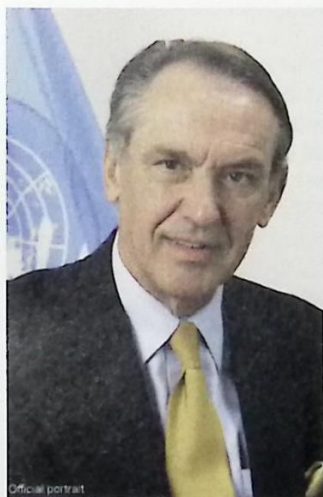
Jan Eliasson