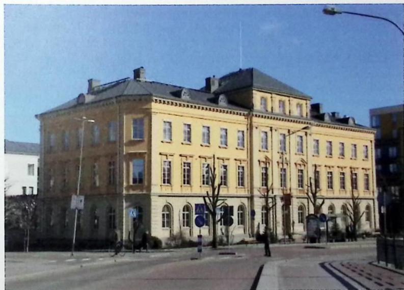
Migrationscentrets lokaler finns i Residentet, Karlstad