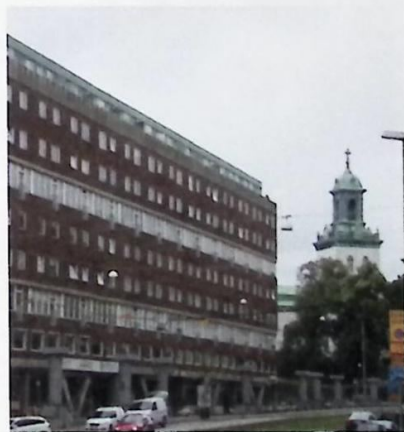
Nu ser bebyggelsen på Karl Johansgatan 35 ut så här