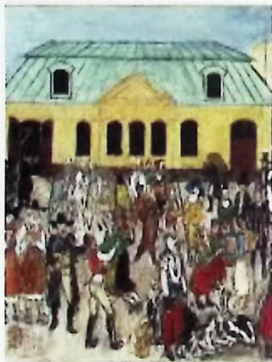
Marknadsliv i gamla Falun med Kopparvågen som fond.

bergsmännen väga in sin färdiga råkoppar för att sedan erlægga produktionskatt och andra avgifter. Här kan man under perioden 1633 – 1873 dagligen följa kopparbergsmännens invägning med varje kopparstycke redovisat för sig. Där fördes nämligen en ”vågkladd” i vilken också vikten för samtliga under dagen invägda stycken summerades. Därefter fördes noteringarna över i den egentliga vågboken . Efter att bergsmannens hela invägning noterats och vederbörliga avdrag gjorts återstod den kopparkvantitet som bergsmannen själv kunde förfoga över.